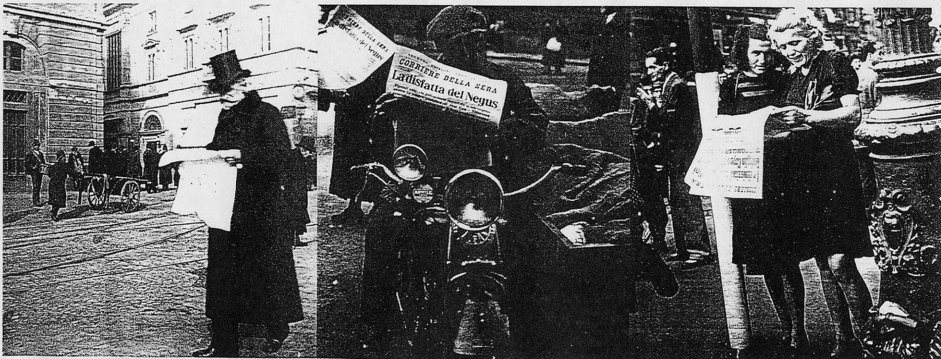
FAME DI NOTIZIE Da sinistra, Giuseppe Verdi davanti alla Scala nel 1890; l'annuncio della vittoria italiana contro l'imperatore di Etiopia Hailé Selassié nel 1936; la lettura delle dimissioni di Mussolini nel 1943